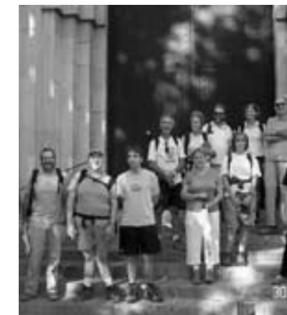
Associació "El Camí" a la porta de l'Església d'Esportes (a l'esquerra) i vista del litoral dels dos pobles (a la dreta)

"El Camí" és una organització que va néixer fa uns anys amb la idea de fer un camí per unir les terres de parla catalana. Es tracta d'un projecte ambiciós que al final ha d'arribar a ser com el famós "Camino de Santiago".