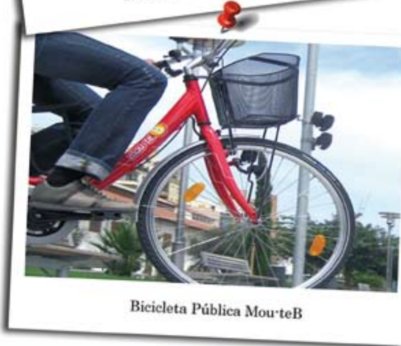
Bicicleta Pública MourteB