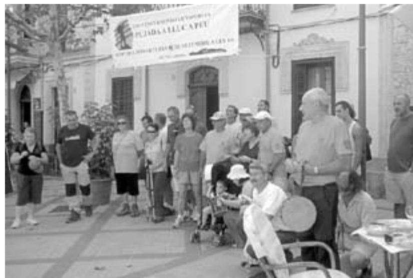
Grup Excursionista d'Esporles al Passeig

Des d'aquí animem a tots els esporlerins i esporlerines a participar fer l'any que a aquesta marxa; amb tots aquests ingredients vos assegurem que es un record inoblidable.