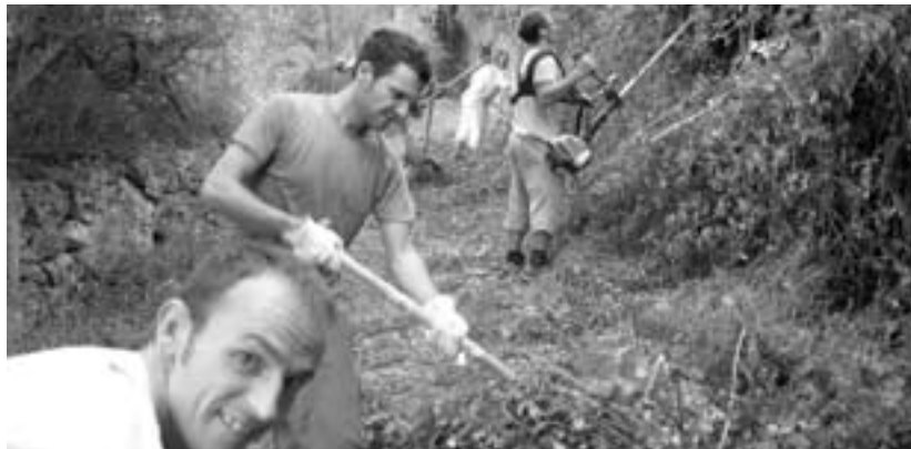
Voluntaris fent net el camí de la Vila Nova a Son Ferrà