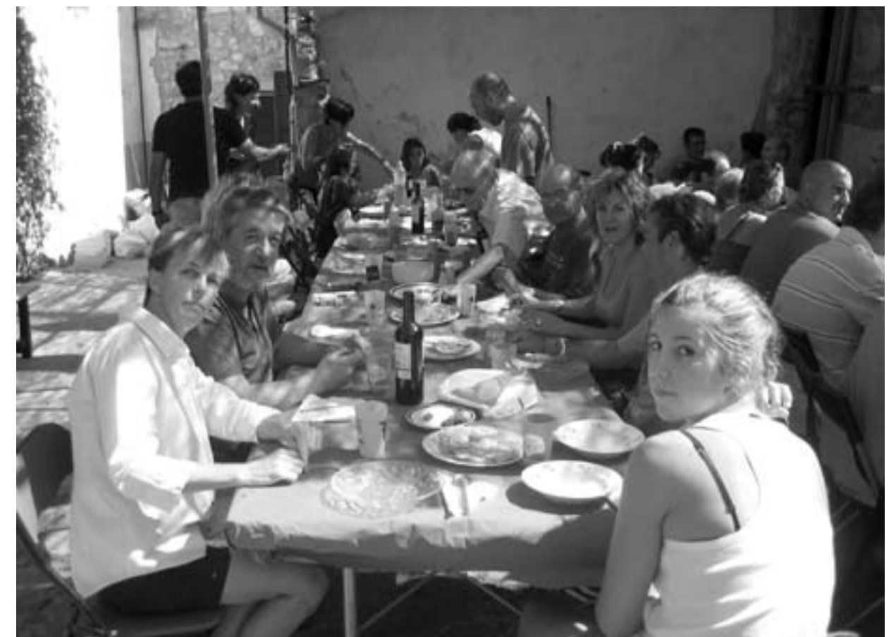
Grup Excursionista d'Esporles al Centre de Dia