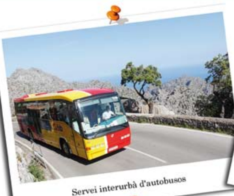
Servei interurbà d'autobusos