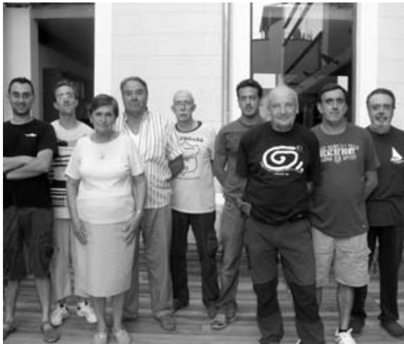
Els Amics del Bonsai d'Esportes al pati de Sa Fàbrica

A partir del gener de l'any que ve, cada primer divendres de cada mes ens reunirem al local de dalt del