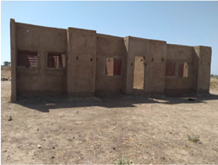
Edifici administratiu de l'institut de Ténado