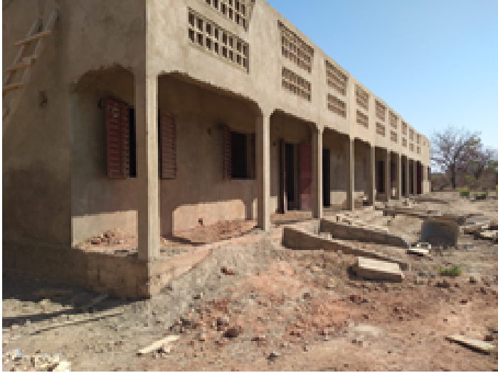
Construcció del bloc de les aules i el magatzem de l'institut de Bavila