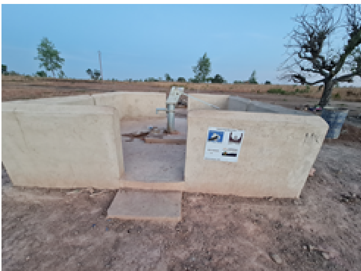
Pou de l'institut de Ténado