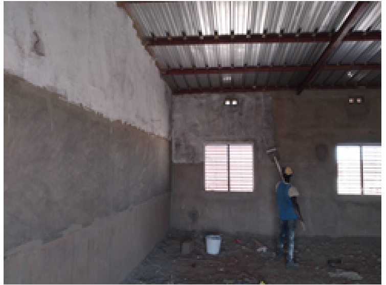
Interior de l'aula de l'institut de Ténado