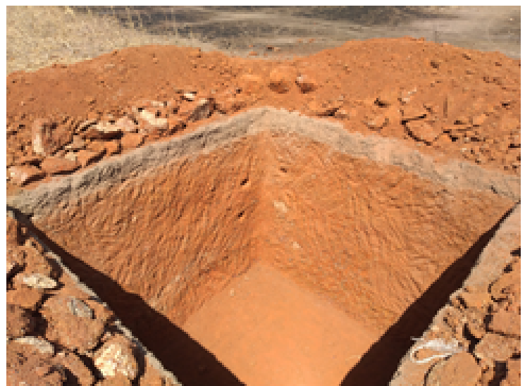
Construcció de les latrines de l'institut de Ténado