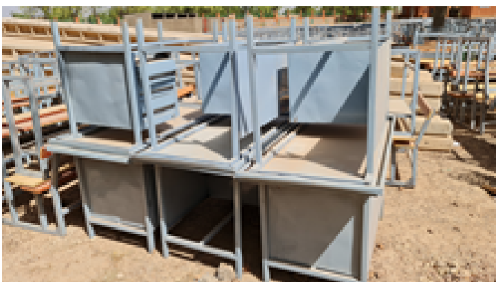
Mobiliari: taules i pupitres