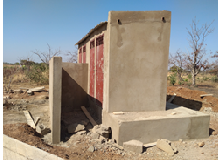
Construcció de les latrines de l'institut de Bavila